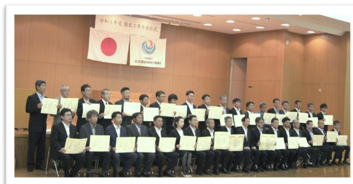
事務所長表彰受賞者